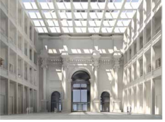
Blick in die Eingangshalle des Humboldtforums

und Unterhaltung unterstützt die ZLB Menschen in ihrer geistigen und kulturellen Bildung und fördert ein tolerantes und offenes Weltverständnis. In das Humboldtforum ziehen die beliebten Abteilungen Kunst, Musik, Film und die Kinder- und Jugendbibliothek ein. Sie werden ein breites Spektrum verschiedener Medien zur Verfügung stellen – vom klassischen Buch über Hörbücher, CDs und DVDs bis hin zu digitalen Medien, wie e-books. Diese Vielfalt wird in modernen, mediengerechten und gestalterisch anspruchsvollen Umgebungen angeboten.