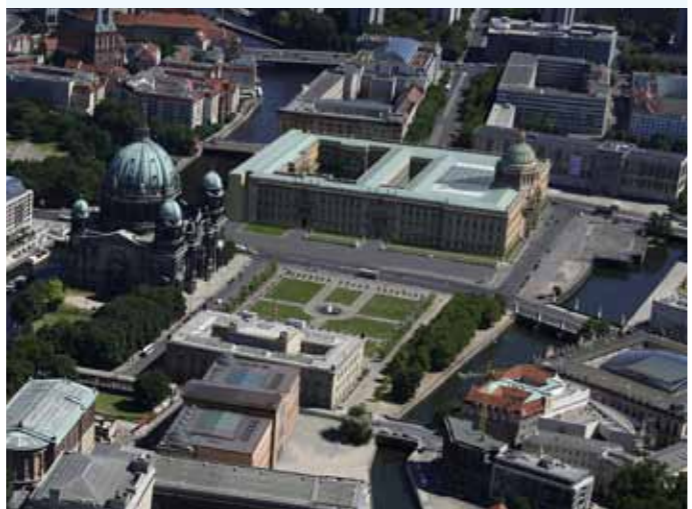
Luftbild Berliner Schloss – Humboldtforum

Unter den Linden bekommt mit den barocken Schlossfassaden seinen ganzvollen Bezugspunkt zurück. Mit dem Schlossforum, einer Fußgängerstraße quer durch das Gebäude, werden das Humboldtforum im Schloss und seine Innenhöfe zu öffentlichen Orten der Stadt. Nach Osten zum Alexanderplatz hin zeigt sich das Gebäude selbstbewusst als Neubau. Hier spricht der Architekt – unter Beibehaltung der architektonischen Grammatik von Fensterwachsen, Geschosshöhen und Fassadengliederung des Barock – in einer modernen Formensprache.